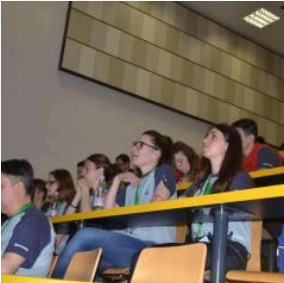
Udeleženci 9. Mednarodnega raziskovalnega tabora ŠPIC.