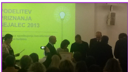
Slovenski forum inovacij

angleškem jeziku, kjer so nam predstavili model avstrijske vasice, ki na inovativen način razvija in promovira svoje turistične storitve.