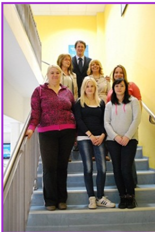
Zmagovalna ekipa VSŠ v projektu Jean Monet

Veselim se sodelovanja z vami in vas skupaj s predavateljskim zborom pristrčno pozdravljam na Višji strokovni šoli v Slovenj Gradcu. Dobrodošli.