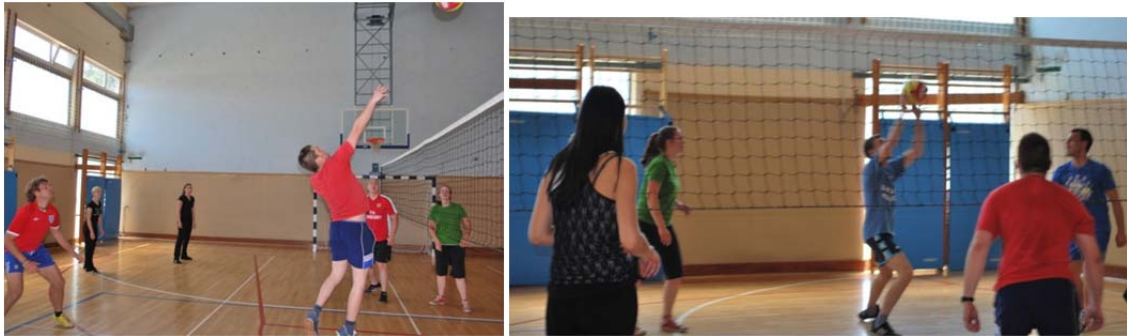
napadalni udarec, podaja in najrazličnejši servisi...

Pri igranju so udeleženci pokazali dobro obvladovanje različnih odbojkarskih elementov, kar dokazuje fotoanaliza.