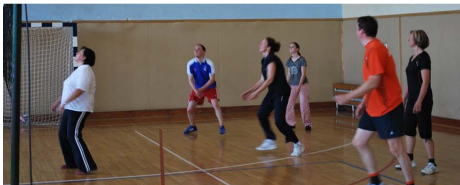
zaposleni na VSŠ