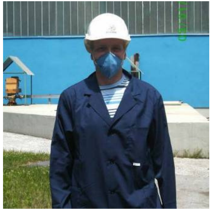
»pripravljen za delo«