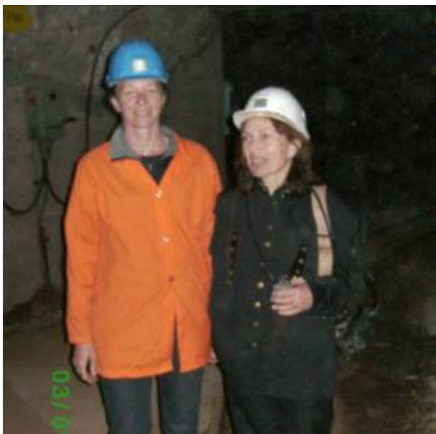
»dve pravi knapovki«