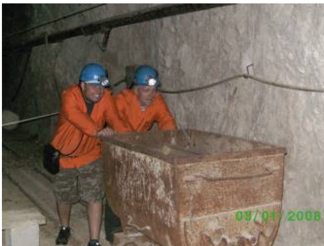
»edina knapa sta morala potiskati voziček«

Od zavoda smo se peljali v muzejski rudnik. Tu se je začela zabava. Obleči smo morali zaščitne plašče in čelade, nekateri so dobili celo akumulatorske svetilke. Porazdelili smo se v vagončke ter se odpeljali na 15-minutno vožnjo po rovu. Ko smo izstopili iz vagončkov, smo se napotili 100 m po rovu do zbirnega mesta in tam smo poslušali uvodne besede nekdanjega »knapa«. Ker so bili z nami še drugi obiskovalci, smo se razdelili v skupine. Dobili smo vodičko, ki nam je med potjo po rudniku odgovarjala na vsa vprašanja. Ko smo prišli na površje, smo hitro odšli proti naslednjemu cilju.