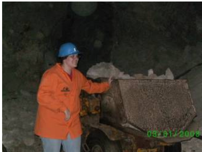
»tudi upravni delavci včasih poprimejo za delo«

Kar me je najbolj impresioniralo je to, da se sploh ne obremenjujejo kako so videti, saj so najbolj iskreni ljudje, kar sem jih spoznala. Zelo radi imajo obiske in povedo kaj o sebi. So zelo družabni in družbe potrebni ljudje. Niso čisto nič drugačni od nas ostalih ljudi in vsak bi se moral z njimi vsaj enkrat pobližje srečati.