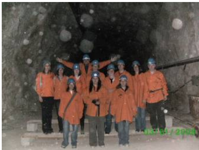
»gasilska slika poslovnih sekretarjev«