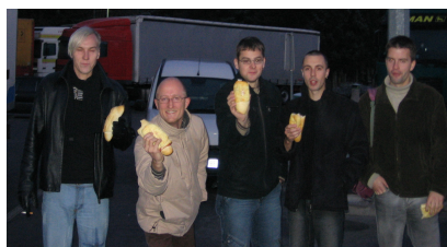
Hudi fantje s hudimi štručkami

Zgodilo se je tisti torek, ko je prvič to zimo v našem mestu zapadlo dovolj snega za kepanje. Vse skupaj se je začelo okoli pete ure zjutraj, ko je avtobus odpeljal iz Slovenj Gradca. Večina je precej hitro zadremala, tako da smo, kot bi trenil, že malicali odlične štručke in nekaj malo daljših trenutkov za tem ponosno stali pred vhodom v Hit. Verjetno ni potrebno razlagati, kako izgleda igralnica, pa bom vseeno omenil, da je ogromno lučk in kičastih napisov na tisočeri avtomatih. Nekateri so prvič a ne zadnjič na ekskurziji poizkusili srečo.