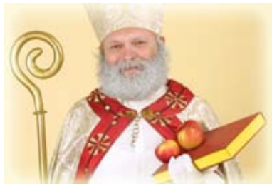
Damjan J. Ovsec. Velika knjiga o praznikih . Ljubljana: Domus, 1993

Na razvoj Miklavževe šege je najbrž bistveno vplivala tudi naslednja legenda: Neki krčmar (po drugih poročilih mesar) naj bi umoril tri popotne šolarje, študente, jih razsekal in skrnil v kadi. Sv. Miklavž je pripotoval mimo, zaznal zločin in tri nesrečne šolarje obudil v življenje. Zaradi te prigode so ga šolarji in študentje izvolili za svojega zavetnika. K temu je pripomogla srednjeveška šega, ki sicer izvira iz rimskih časov, da so na god nedolžnih otročičev, 28. Decembra, v samostanih volili »deškega škofa«, ki je imel tisti dan v rokah vso oblast. Ta šolarski praznik so prenesli na 6. december. Postavi »deškega škofa« in sv. Miklavža sta se od 13. stoletja dalje polagoma spojili, šega pa se je razširila iz samostanskih in stolniške in župnijske šole, od koder je po raznih spremembah prišla na deželo, kjer se je ohranila do današnjih dni.